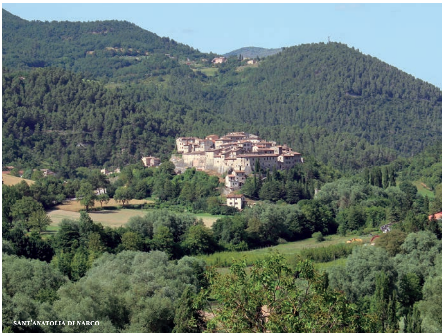
SANT'ANATOLIA DI NARCO