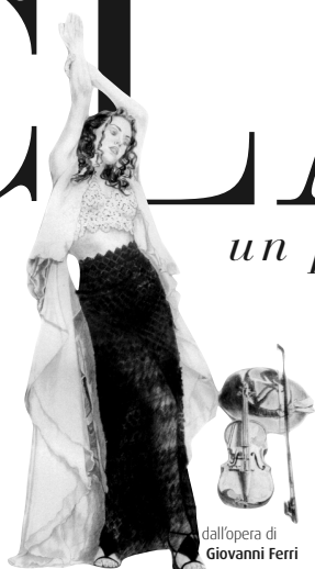
dall'opera di Giovanni Ferri

Master Class e Stage: dal 21/27 e dal 28/30 luglio