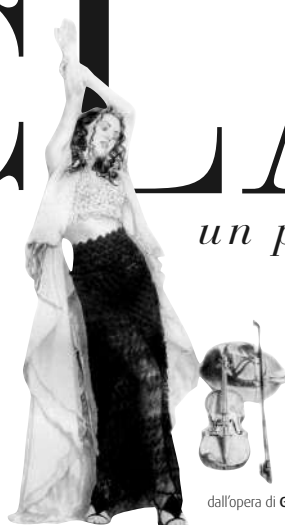
dall'opera di Giovanni Ferri

Associazione Culturale Nuova Tradizione Musicale